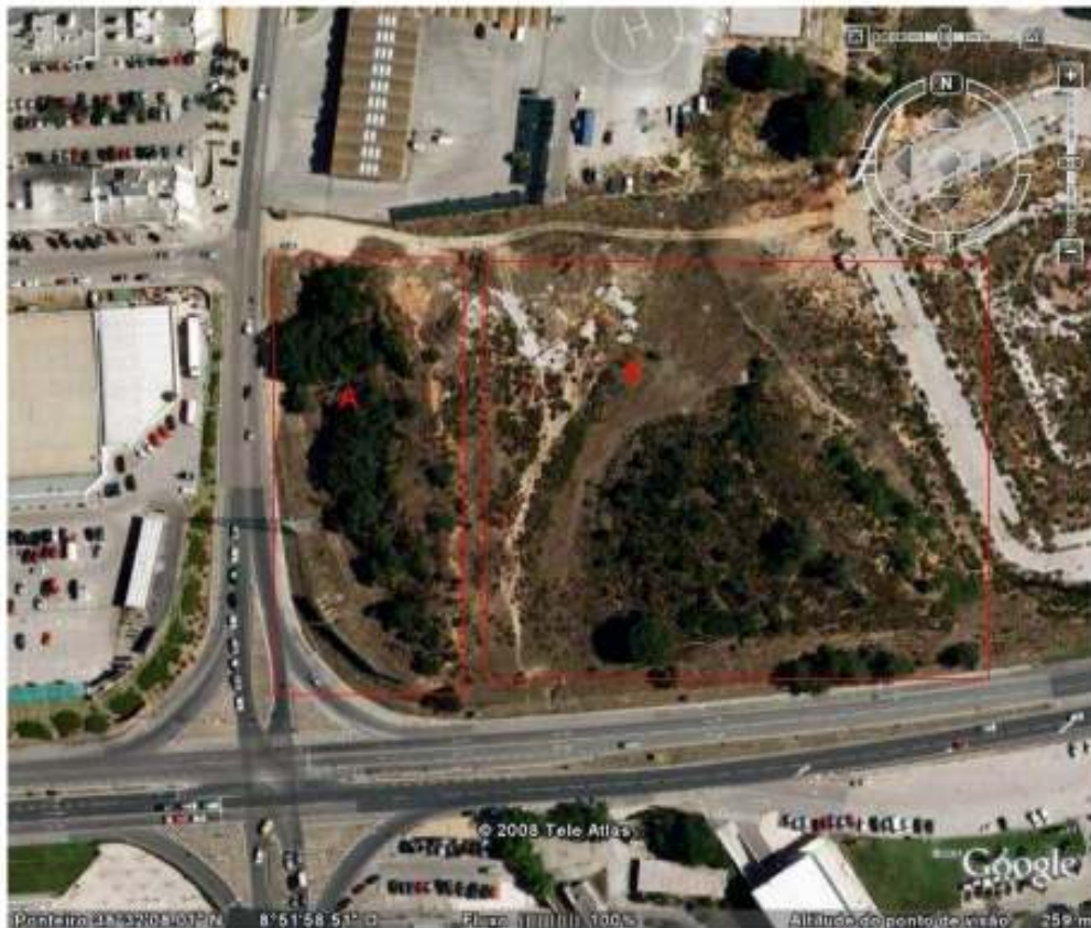
Figura 1. Localização do projecto, com indicação da área onde ainda se encontram exemplares adultos de sobreiro (A) e a área que foi destruída por corte da vegetação e aterro (B).

de grande valor, poderia representar um valor acrescentado para a qualidade de vida da população local.