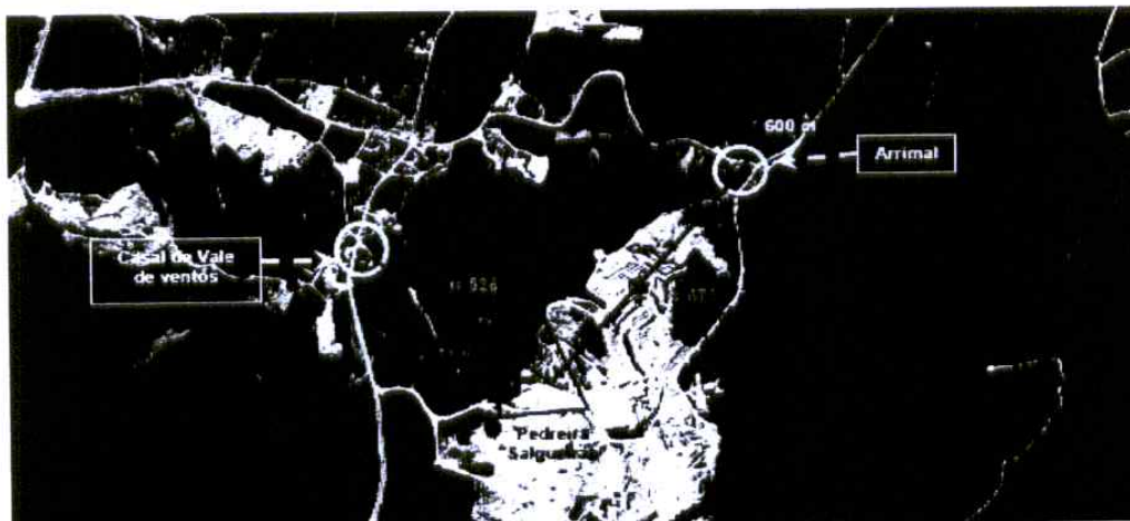
Figura 2 – Foto aérea com a localização da pedreira e dos receptores sensíveis mais próximos.