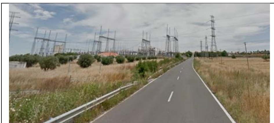
Rede viária (próximo à Subestação elétrica de Ferreira do Alentejo)