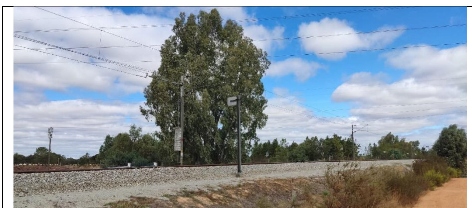
Rede ferroviária (em Ermidas do Sado)