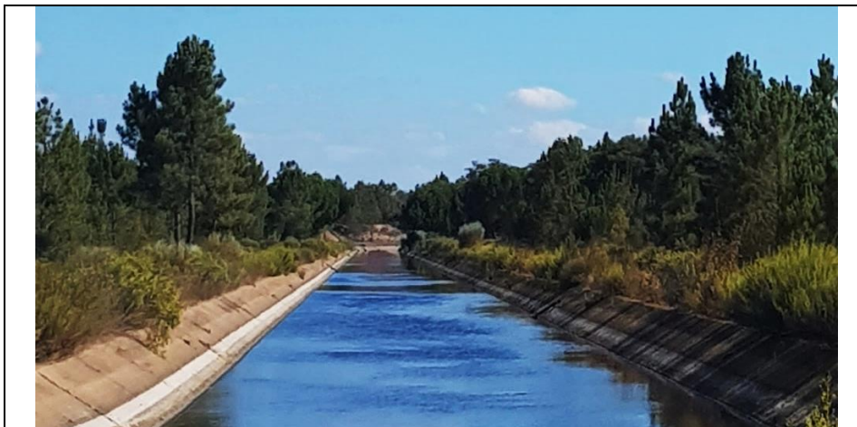
Curso de água artificializado