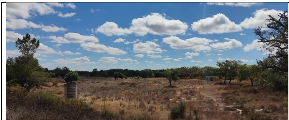
Albufeira de represa (em período de seca)