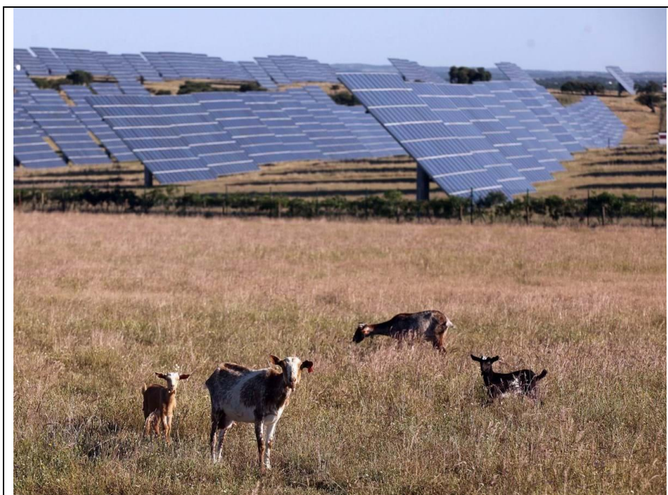
Infraestrutura de produção de energia renovável (Central Fotovoltaica de Ferreira do Alentejo)