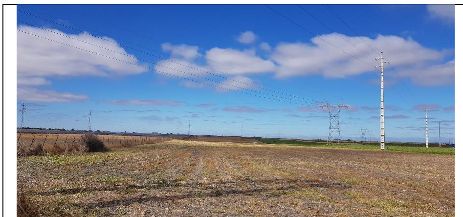
Cultura temporária de sequeiro e regadio