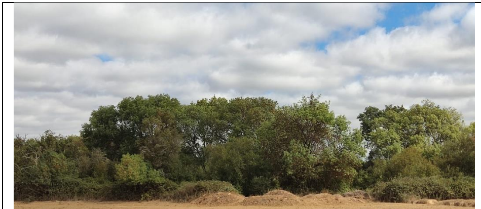
Floresta de outras folhosas