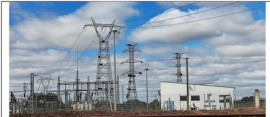
Infraestrutura de transformação de tensão e distribuição de energia (subestação REN de Ermidas do Sado)