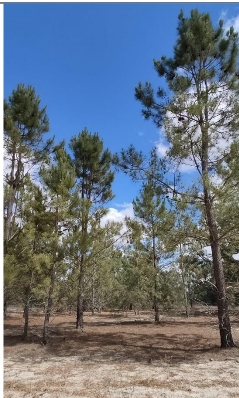
Floresta de pinheiro-bravo