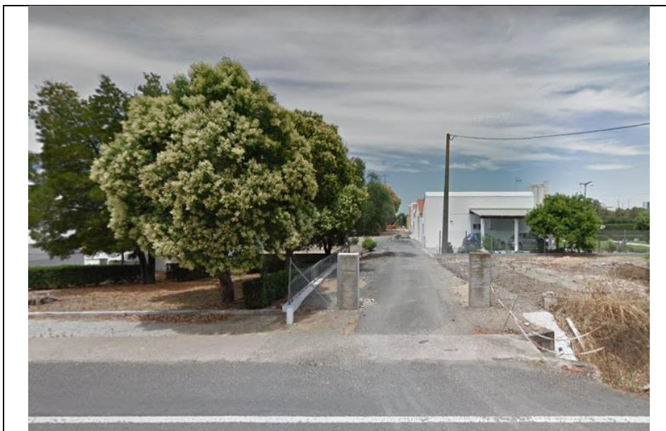
Tecido edificado descontínuo esparsos (imedição da subestação de Ferreira do Alentejo)