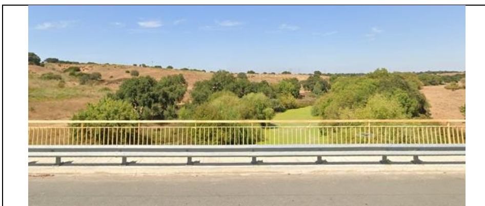
Curso de água natural (rio Sado)