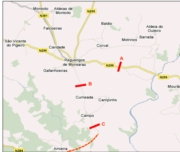
Sem Parque Alqueva