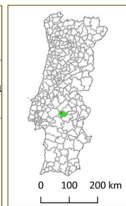
Figura 4.1 Enquadramento geográfico da Fabrica de Transformação de Tomate em análise