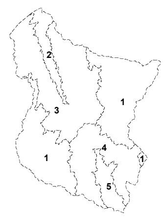
Subunidades de paisagem