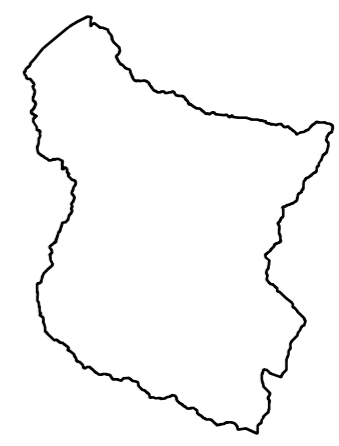
Área de influência visual