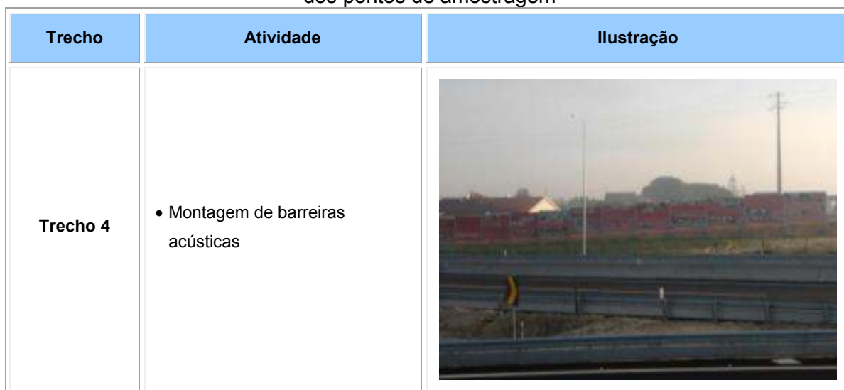
Quadro III: Atividade construtivas desenvolvidas nas proximidades dos pontos de amostragem