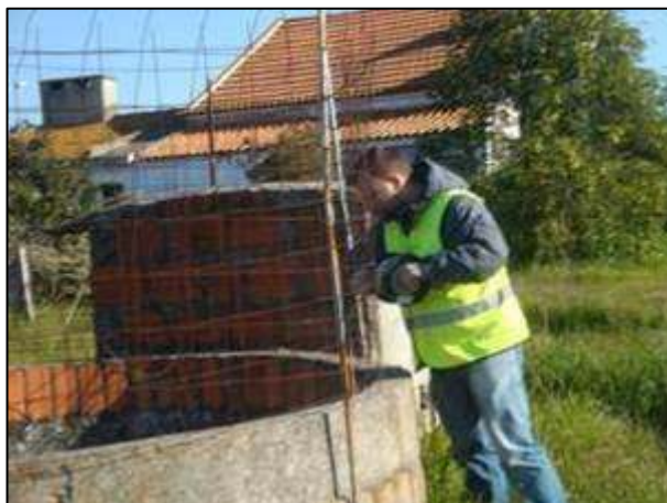
Fotografia 1: Medição da coluna seca com recurso a sonda portátil