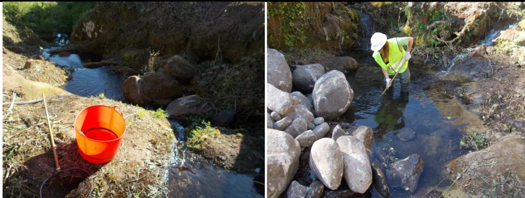
Figura 1. Situação inicial (parcela inicial) / localização inicial