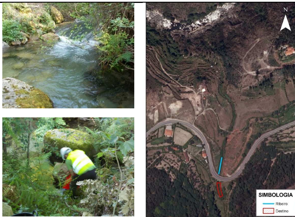
Figura 2: Situação final / Localização final