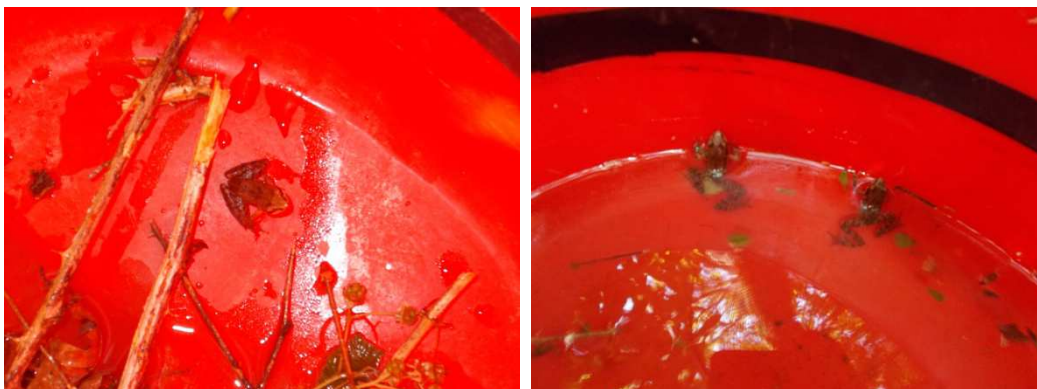
Figura 3: Detalhes da atuação