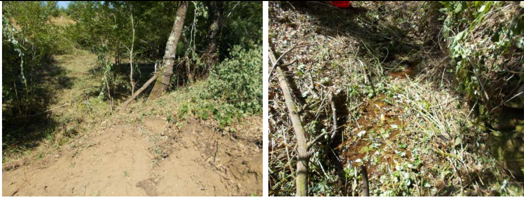
Figura 1. Situação inicial (parcela inicial) / localização inicial