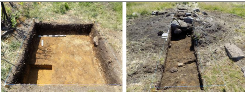
Figuras 1 a 4 – Alguns exemplos de sondagens realizadas no período

MOTIVO DA REVISÃO/ ALERAÇÕES EFETUADAS PROPOSTAS