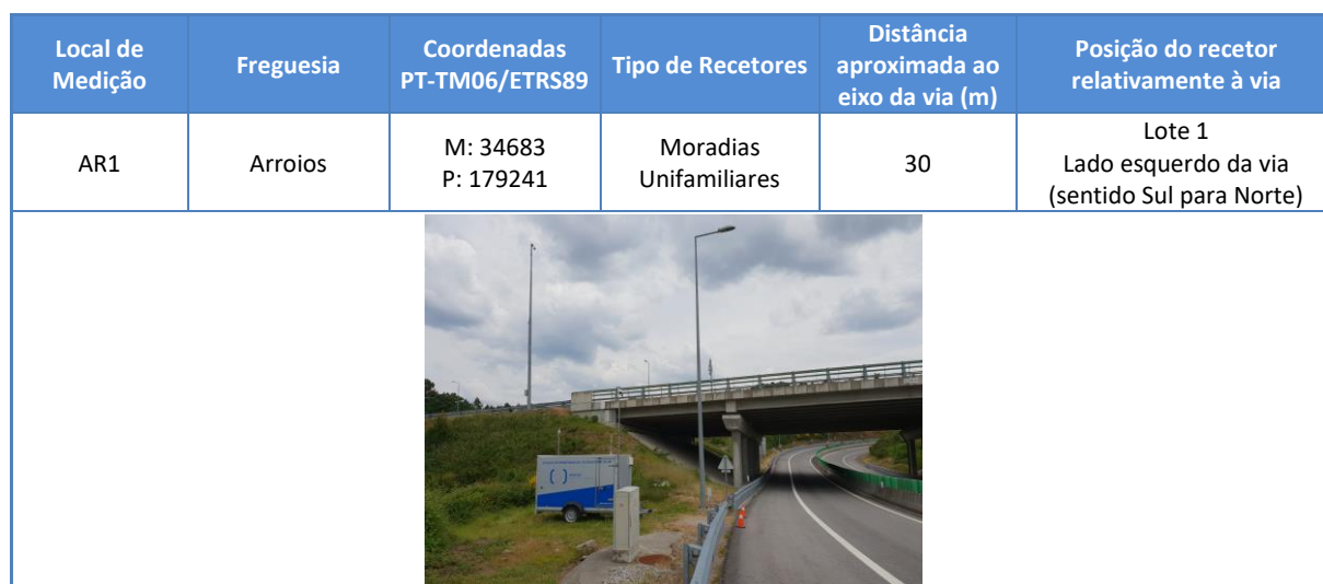
Tabela 9: Local de medição para monitorização da qualidade do ar.

Foi selecionado o local de monitorização representativo dos recetores sensíveis a caracterizar, tendo em consideração as limitações técnicas da instalação de uma estação móvel de monitorização da qualidade do ar. O local de medição definido encontram-se indicado na Tabela 9 e pode ser consultado de forma mais pormenorizada no respetivo relatório de ensaio anexo.