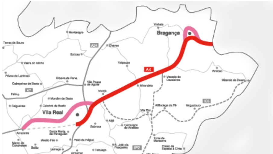
Figura 1 - Localização genérica da Subconcessão Autoestrada Transmontana.

A Operestradas XXI, SA., por sua vez, é a entidade contratada pela Subconcessionária Autoestradas XXI, SA para proceder à Conservação, Manutenção e Exploração das vias que constituem a AE Transmontana, sendo, como tal, a sociedade operadora.