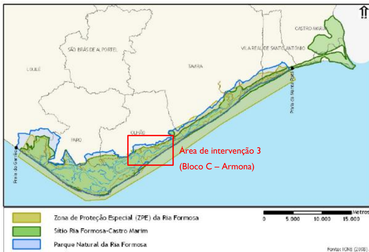
Figura 1 – Localização da Área de Estudo.

A área do projeto – área de intervenção 3 (Bloco C – Armonia) (Figura 1), encontra-se inserida no Parque Natural da Ria Formosa (PNRF). A sua importância para a conservação da natureza, nomeadamente para a avifauna selvagem, levou à sua classificação como Zona de Proteção Especial (PTZPE0017), pelo Decreto-Lei n.º 384-B/99, de 23 de setembro. A Ria Formosa insere-se também no Sítio Ria Formosa-Castro Marim (PTCON0013), pela Resolução de Conselho de Ministros n.º 142/97, de 28 de agosto. Encontra-se ainda incluída na lista de Sítios Ramsar (zonas húmidas de importância internacional) desde 1980. A Ria Formosa constitui um sistema lagunar costeiro com elevado hidrodinamismo associado e de grande valor ecológico.