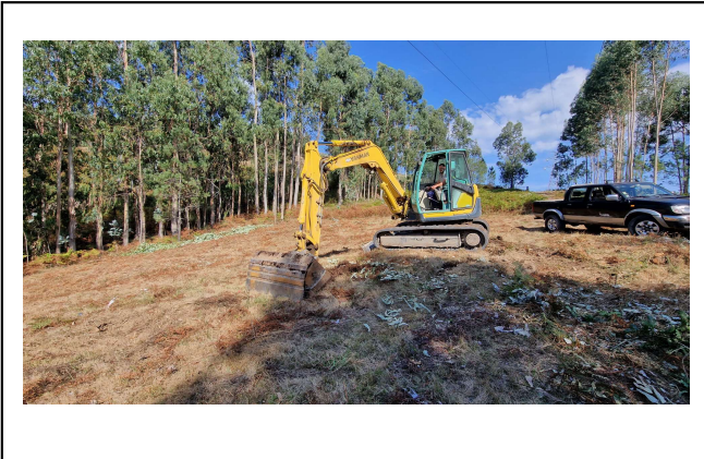
Foto 1: Vista geral do início dos trabalhos de abertura de caboucos