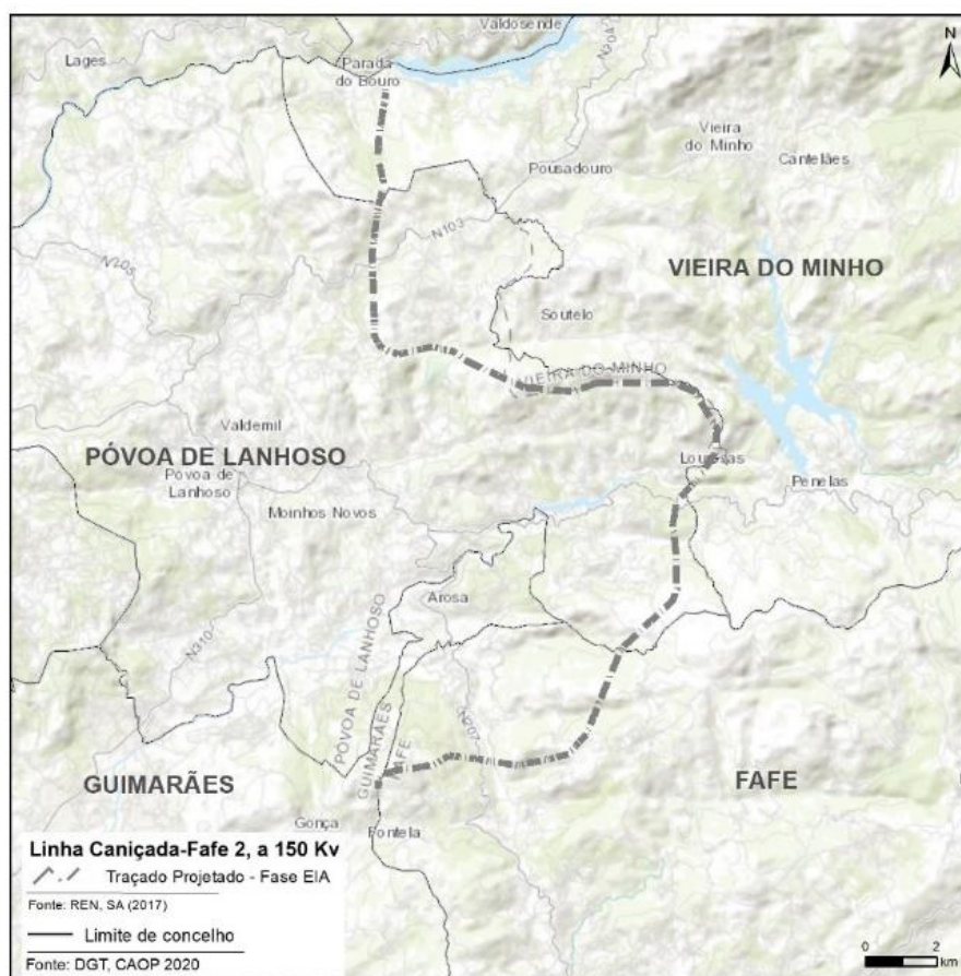
Figura 2.1 – Traçado proposto em fase de EIA

(S006153-201902-DAIA.DAP/DAIA.DAPP.00292.2018). Na Figura seguinte apresenta-se o traçado caracterizado e avaliado no âmbito do EIA.