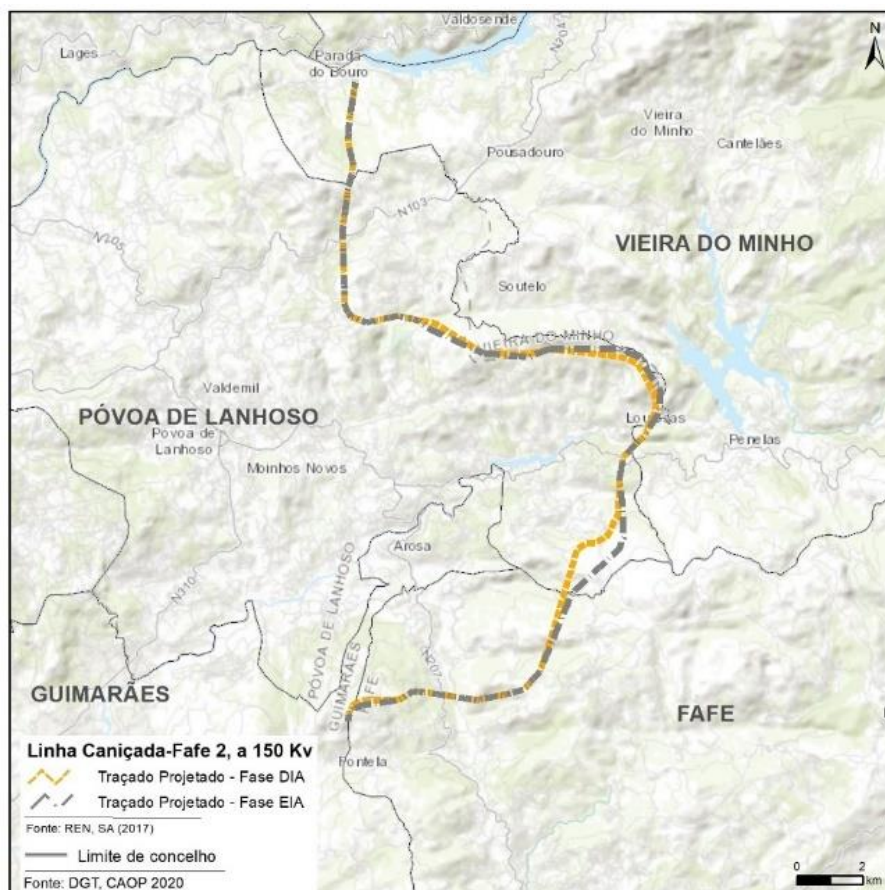
Figura 2.2– Traçado proposto em fase de DIA

Embora tenham sido seguidas as recomendações da APA no que diz respeito à DIA emitida, foi recebido um novo comunicado, com a referência S035397-202006-DAIA.DAP/DAIA.DAPP.00292. 2018, de 24 de junho de 2020, no qual a APA, em resultado também da apreciação por parte de diferentes entidades representadas na Comissão de Avaliação (CA), conclui pela necessidade de reformular o traçado apresentado em fase de DIA, por se concluir a existência de um incremento do impacte ao nível do património cultural decorrente da deslocalização do Ap39 uma vez que a nova localização aproxima-se de forma significativa da ocorrência 229 (Aldeia Turística).