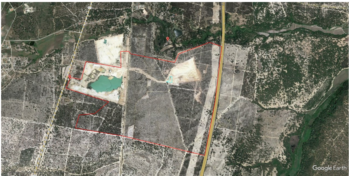
Figura 1. – Localização da fonte ("Sifucel - Sílicas, S.A.") e dos pontos de medição

R2 - Habitação unifamiliar sita junto ao portão de entrada da empresa junto ao IC1 (receptor sensível). Coordenadas: 38°17'17.91"N 8°32'7.56"W