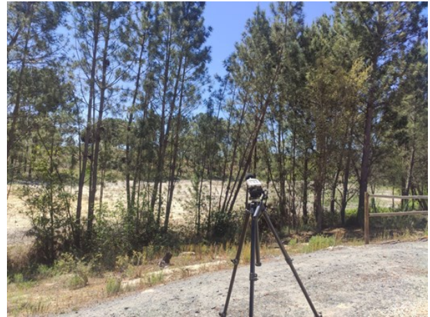
Figura 2 – Localização do equipamento de medição - Ponto R1