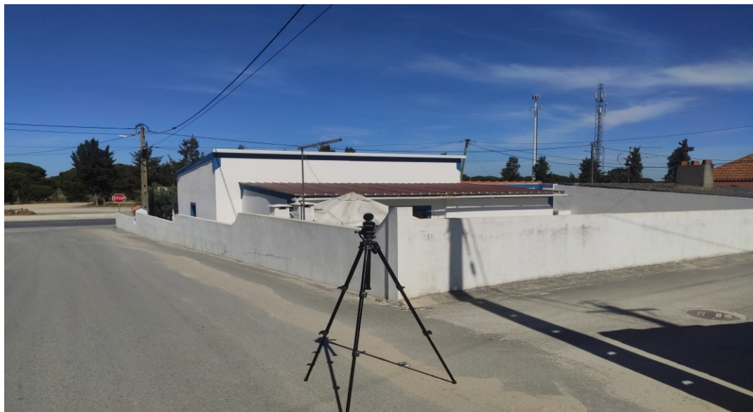
Figura 3 – Localização do equipamento de medição - Ponto R2