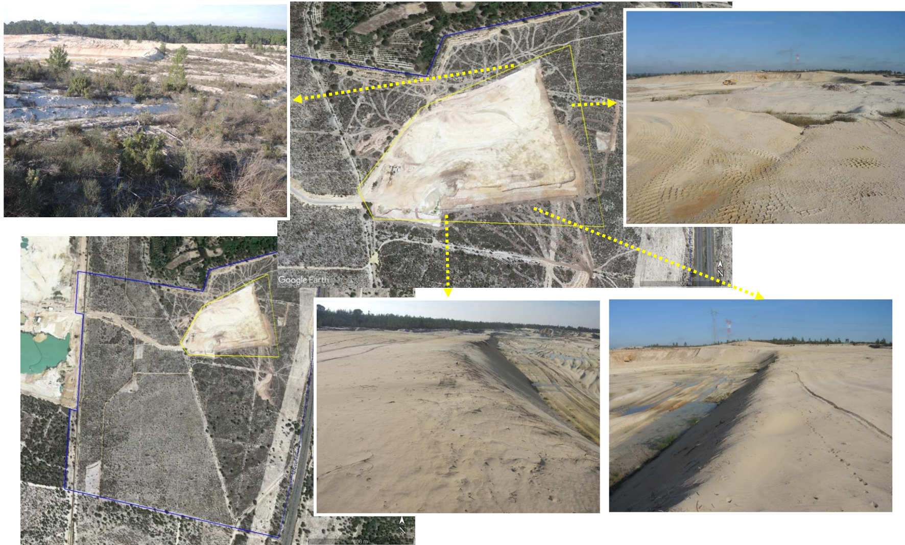
Imagem 2 – Imagem ilustrativa do estado atual da exploração (polígono amarelo)