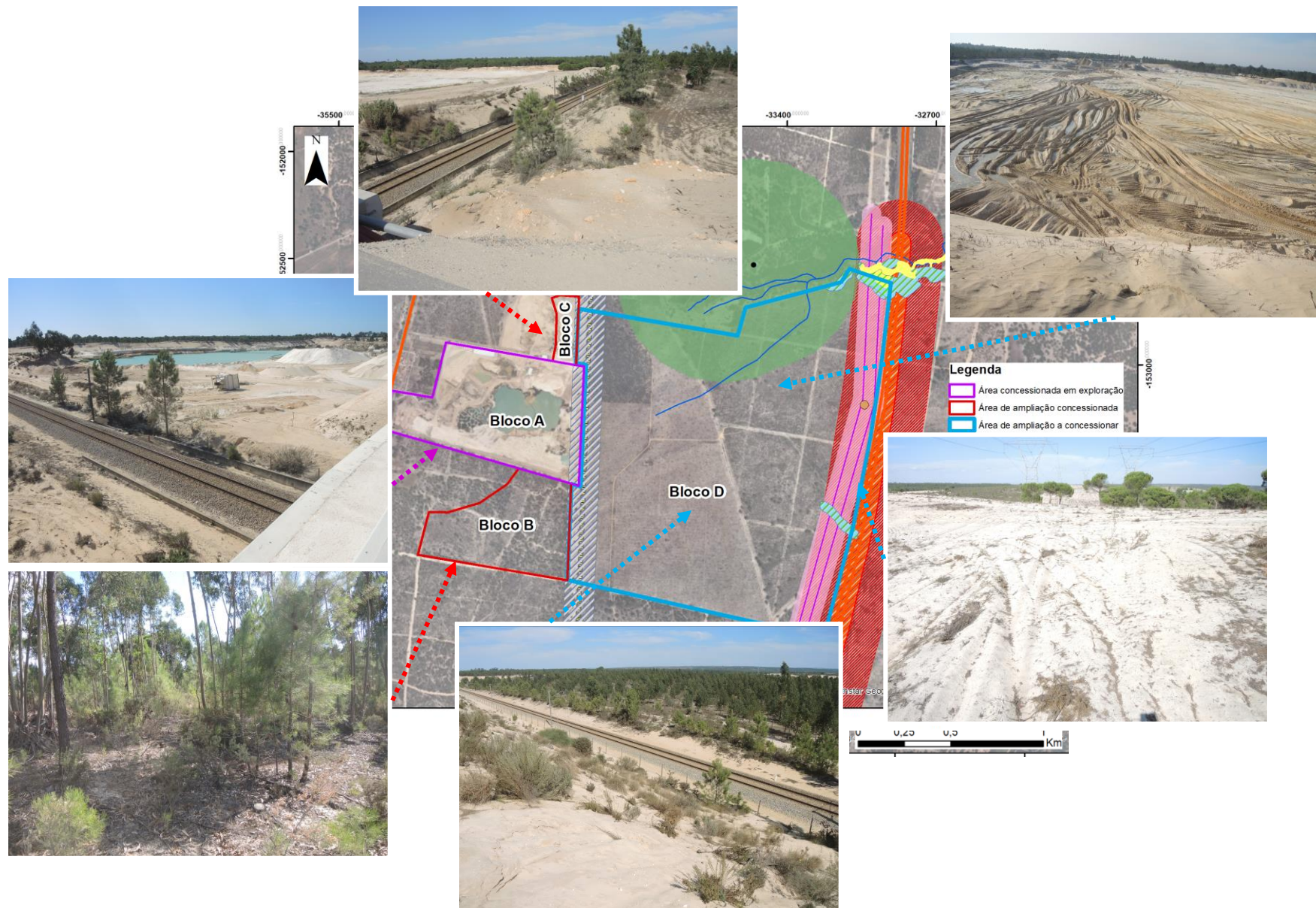
Imagem 1 - Implantação do projeto no ortofotomapa e aspectos distintos do seu estado atual dos diferentes Blocos.